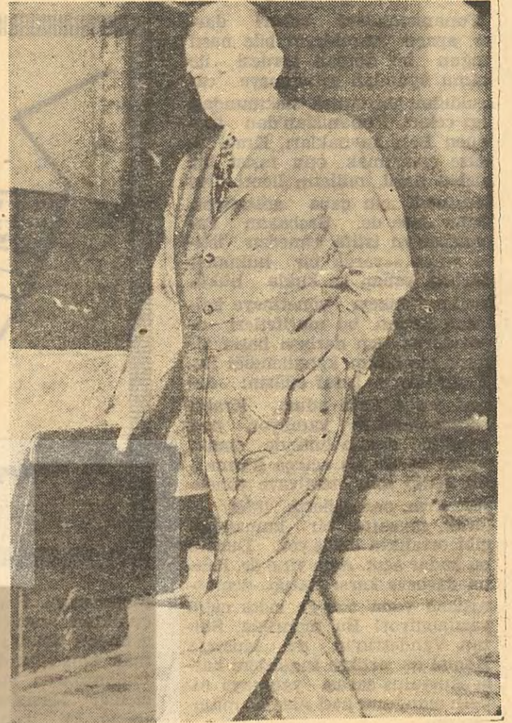
CHP Genel Başkanı İsmet İnönü

Yunanlılar, görüş ayrılıklarınız ne olursa olsun, diktatörlüğe hayır diyerek, milli haysiyet ve vekarımızı ko-